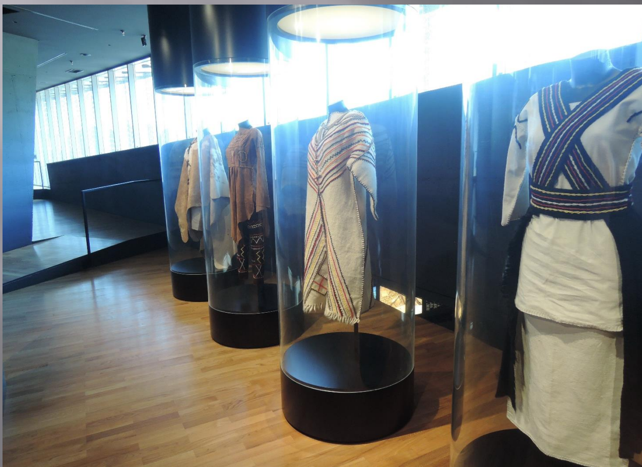
Odjevni predmeti rekonstruirani na temelju arheoloških nalaza, slika i ornamentike na glinenim posudama iz razdoblja vrhunca vučedolske kulture (3000. do 2500. p.Kr.)