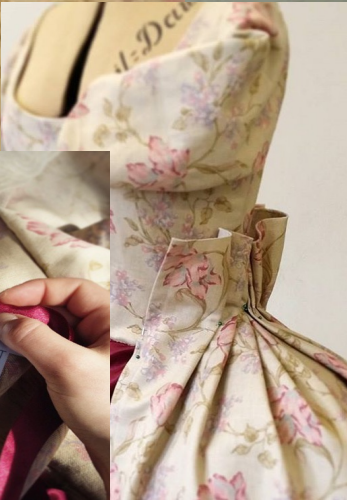
Sl. 4, 5, 6, 7, Primjer izrade ženske odjeće kraj 17. stoljeća, Sandra Škaro