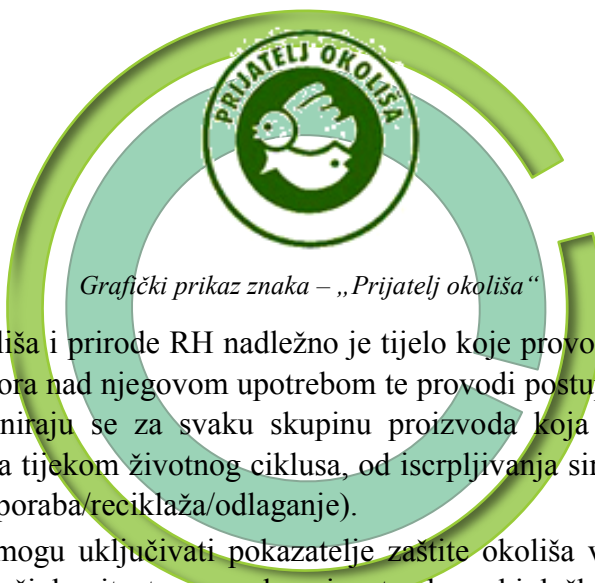
Grafički prikaz znaka – „Prijatelj okoliša“

Pripada Tipu I eko-oznaka i deklaracija prema međunarodnoj normi EN ISO 14024:2018, (HRN EN ISO 14024:2018 - Znakovi i izjave o zaštiti okoliša -- Označivanje znakovima zaštite okoliša tipa I -- Načela i postupci). Izgled znaka propisan je Pravilnikom o znaku zaštite okoliša (NN 91/2016), sl.1.