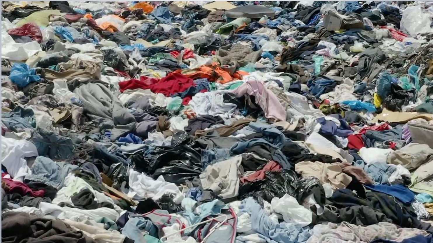
Illegalno odlagalište odjeće u čileanskoj pustinji Atacama

Da bi se smanjila kupnja novih odjevnih predmeta koji imaju vrlo lošu kvalitetu, potrebno je podići svijest kupaca o štetnosti takve kupovine i ekološkom otisku koji stvaramo takvom kupnjom.